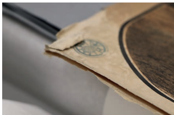
Les supports sur lesquelles certaines œuvres ont été collées pour les rigidifier doivent être retirés car ils endommagent les œuvres