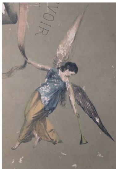
Les insectes comme le poisson d'argent se nourrissent de papier, provoquant des petits trous