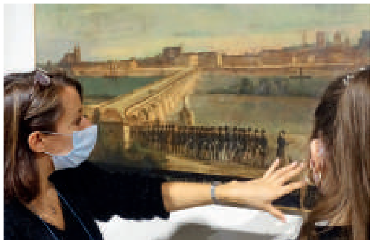
Visite commentée des conduites exposées au Musée

Il attire notamment un public familial et touristique. Il propose visites, expositions et animations autour des thèmes des métiers, de l'histoire du compagnonnage, des grands chefs-d'œuvre du musée ou de compagnons célèbres. Il organise aussi des rencontres entre visiteurs et compagnons, notamment lors des Journées du patrimoine. Il offre aux jeunes publics, notamment aux écoles, un large choix d'animations et ateliers permettant de découvrir le compagnonnage, les métiers, l'artisanat... Il dédie aussi des contenus adaptés aux publics empêchés, particulièrement aux apprenants en langue française.