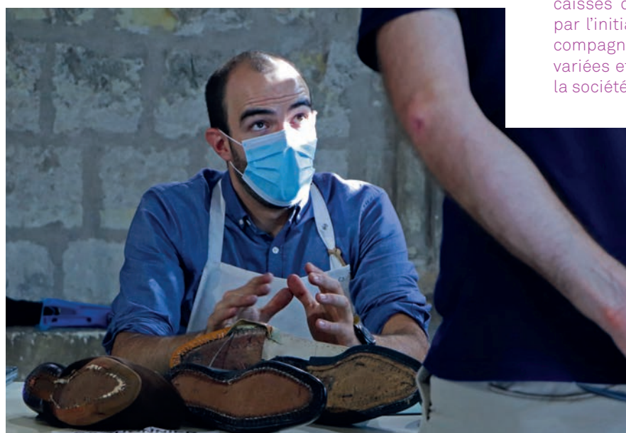
Un aspirant cordonnier-bottier lors des Journées du patrimoine 2020 au Musée de Tours