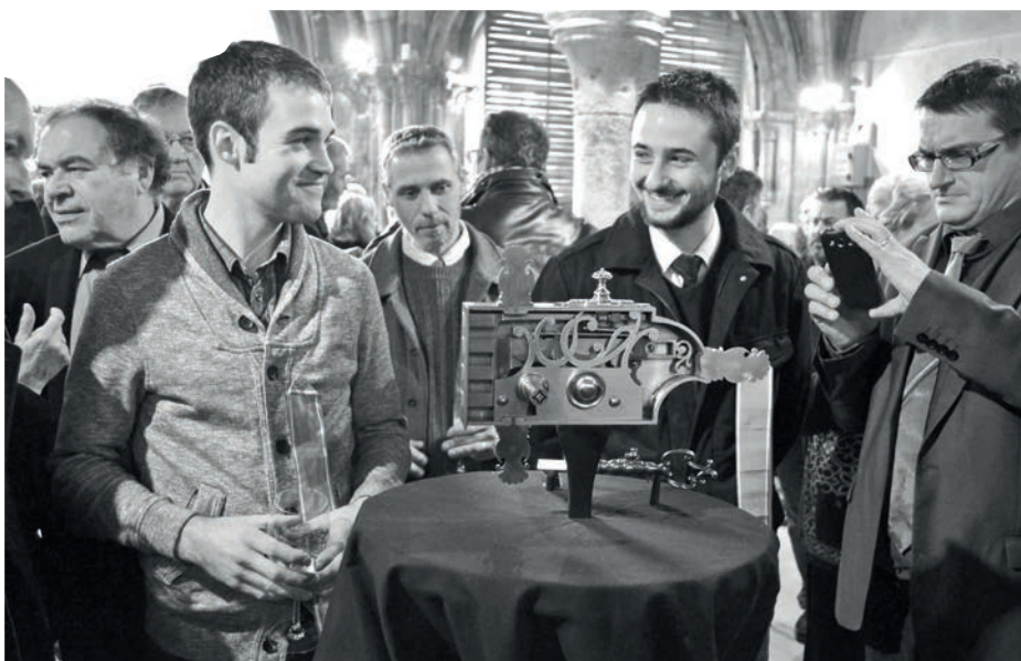
Deux aspirants présentant leur travail, serrure à clé-pistolet, en 2016 au Musée de Tours

http://fondation-patrimoine.org/oeuvres-du-musee-du-compagnonnage-a-tours